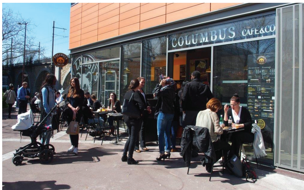
Le Columbus Café en gare d'Issy Val de Seine permet à nos voyageurs de s'accorder une pause détente.